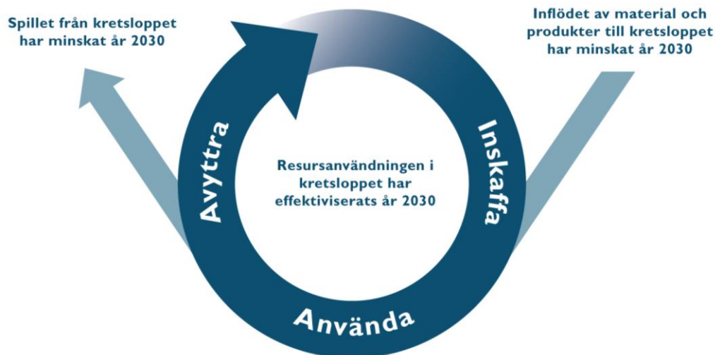
Figur 1 Tre övergripande mål har formulerats för den nya gemensamma kretsloppsplanen. Dessa fungerar också som utgångspunkt för barnkonsekvensanalysen.

För att säkerställa att barnens behov inte åsidosätts i processen med att ta fram kretsloppsplanen och genomföra tillhörande åtgärder har en barnkonsekvensanalys genomförts.