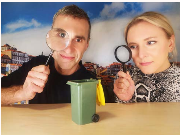
Avfallet - en riktigt sopig podd finns bl.a. på Spotify.