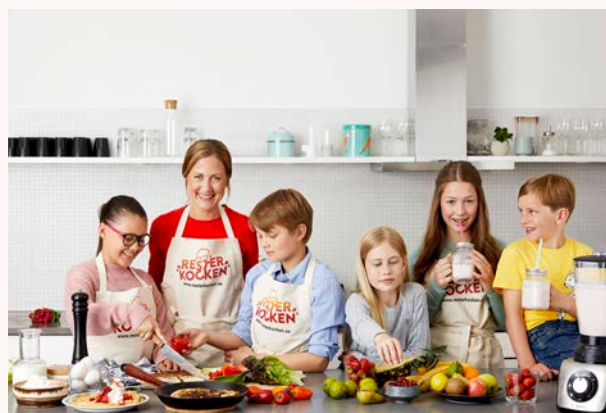
I Resterkocken lagar elever i grundskolan mat av kylskåpsrester. Årets tävling startar 1 oktober.