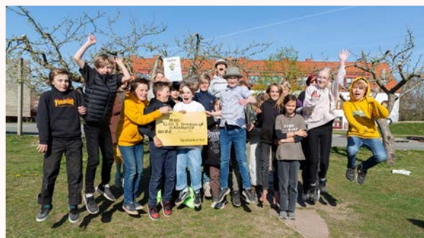
Årskurs 5 på Sophiaskolan i Rörum – glada segrare i 2022 års upplaga av Sladdjakten.