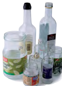
Ofärgade glas- förpackningar