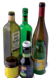
Färgade glas- förpackningar